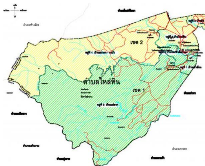
ภาพที่ ๒ ภาพถ่ายการแบ่งเขตของหมู่บ้าน ในตำบลไหล่หิน อำเภอกะเคา จังหวัดลำปาง