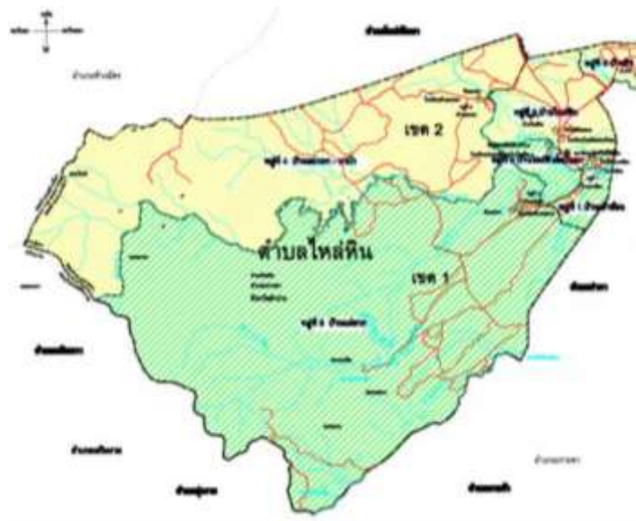
ภาพที่ ๒ ภาพถ่ายการแบ่งเขตของหมู่บ้าน ในตำบลไหล่นหิน อำเภอกะเคา จังหวัดลำปาง