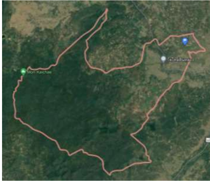
ภาพที่ ๑ แผนที่ภาพถ่ายผ่านดาวเทียม ตำบลไหล่นหิน อำเภอกะเคา จังหวัดลำปาง